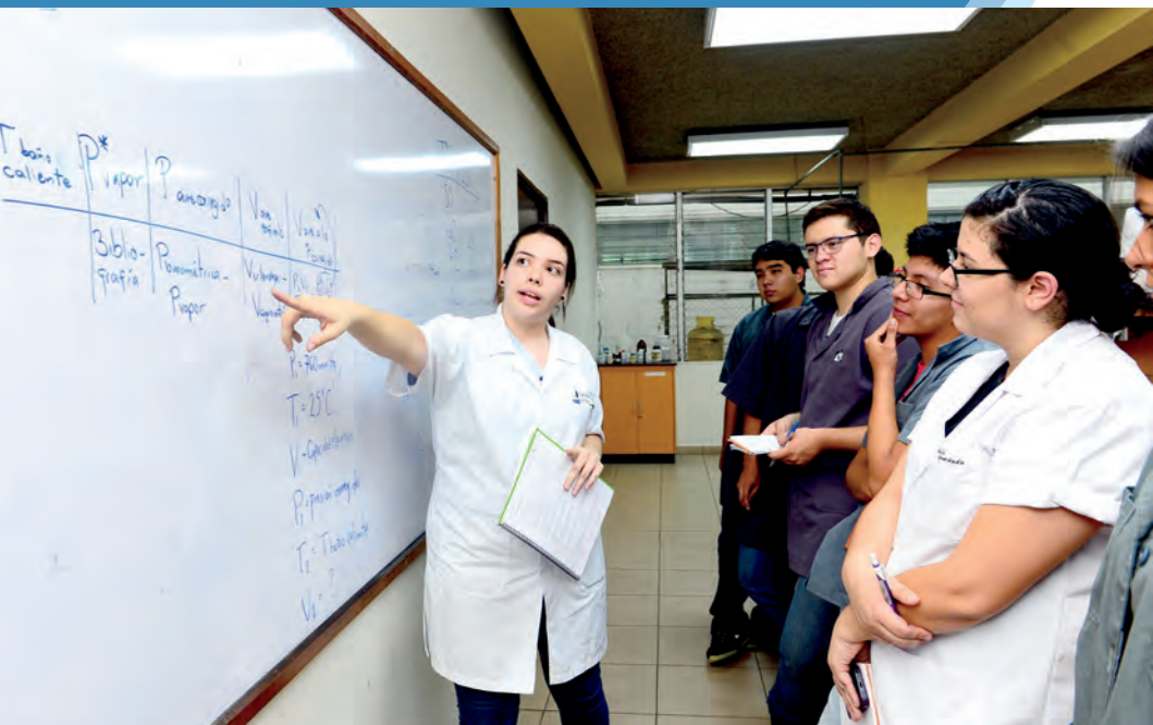
Alumnos de la Facultad de Ingeniería y Arquitectura en discusión de práctica de laboratorio.

*El plan de estudio se encuentra en revisión por lo que no se ha abierto convocatoria de ingreso a la carrera.