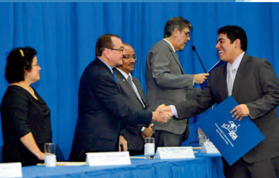
Representación de autoridades ejecutivas durante acto de graduación junio 2016.