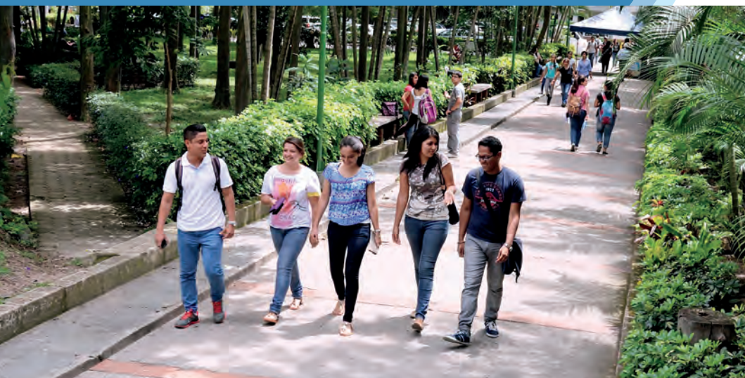
Bosque entrada peatonal