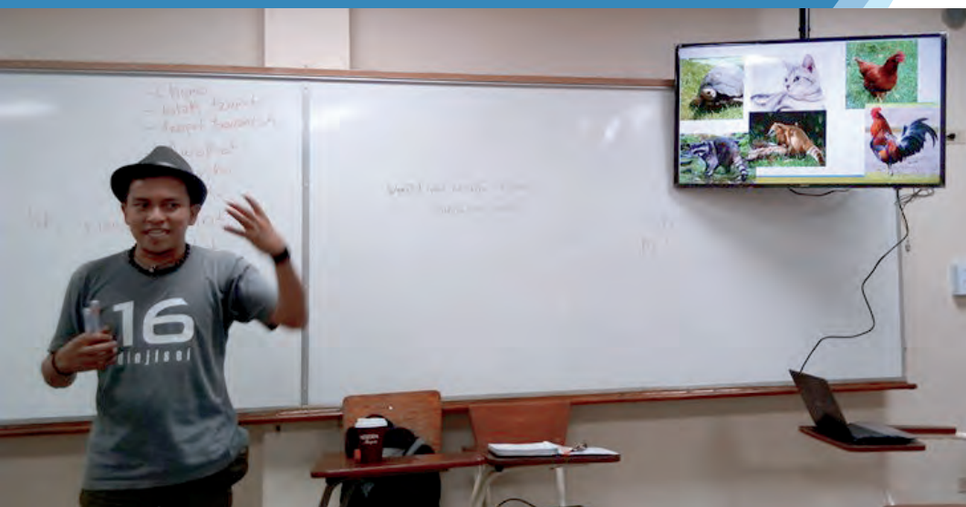
Docente durante las clases de náhuatl impartidas por la Escuela de Idiomas

Los estudiantes y empleados UCA, así como el público en general, tienen la posibilidad de estudiar inglés, japonés, náhuatl y cursos de español para extranjeros en la Escuela de Idiomas de la UCA. Los cursos se imparten en diferentes horarios durante la semana y los sábados.