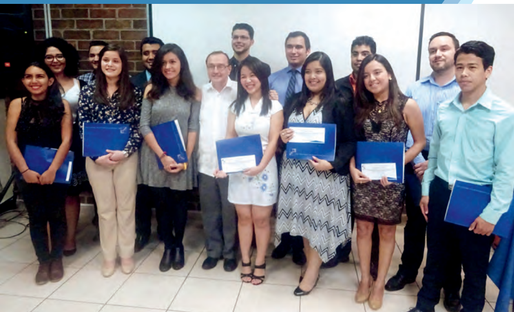
Grupo de becarios para estudios de postgrados.

Todas estas posibilidades abren oportunidades de acceso para que estudiantes con escasos recursos económicos estudien en la UCA.