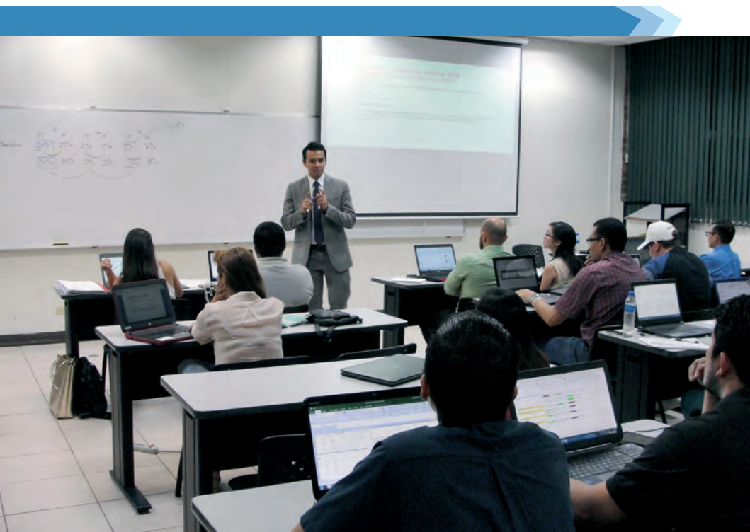
Estudiantes de postgrados durante clase expositiva.

La Universidad cuenta con un Plan de Formación permanente dirigido a todos los académicos, tanto de planta como hora-clase. La oferta de formación está diseñada en modalidad semipresencial y se desarrolla promoviendo las habilidades didácticas, tecnológicas, éticas e investigativas.