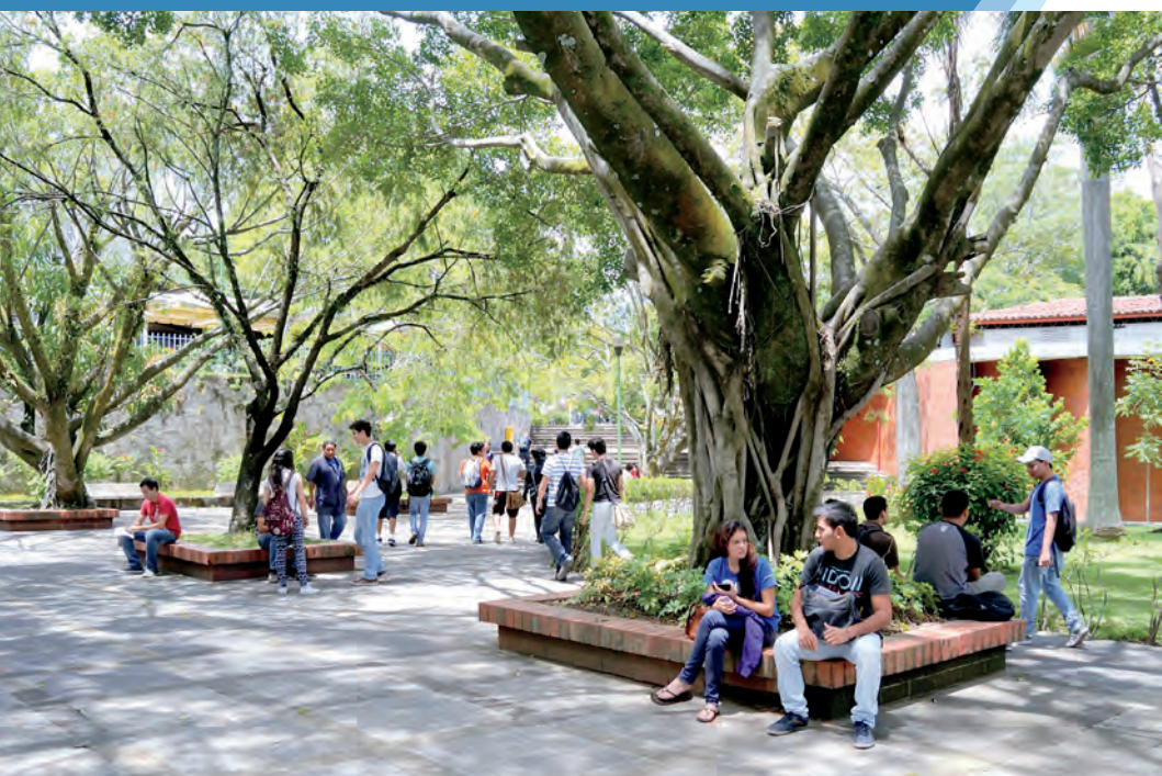
Áreas verdes para descansar y compartir dentro de la Universidad.

área total del campus está compuesta por jardines, espacios al aire libre destinados para que los estudiantes puedan realizar actividades académicas y de convivencia. Aproximadamente el 7% del área total del campus está compuesta por plazas, que constituyen espacios destinados para el encuentro social y desarrollo de actividades culturales.