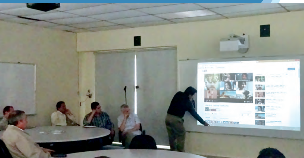
Demostración de funcionamiento de aula Multimedia UCA