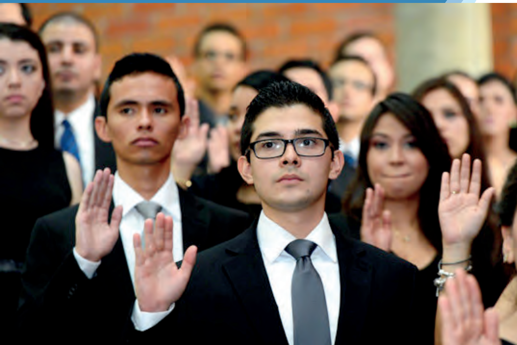
Toma de protesta a graduados en acto de graduación 2016.