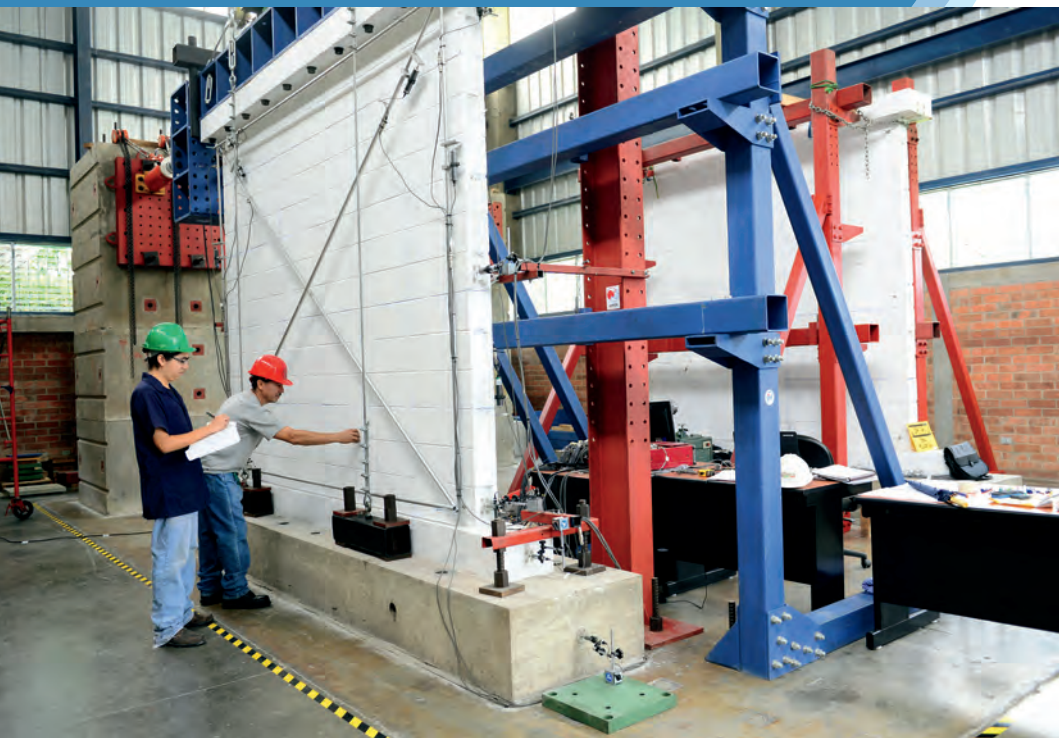
Investigación en Laboratorio de Estructuras Grandes

El tema fundamental de la investigación de la UCA es la realidad nacional, con el propósito de incidir y proponer soluciones a los problemas que afectan a la sociedad salvadoreña y centroamericana. La Universidad busca que la producción de conocimiento y la investigación sean instrumentos al servicio de las causas de los pobres y excluidos para buscar soluciones equitativas y justas a los problemas nacionales y regionales. Además, desde la formación permanente, se pretende potenciar investigaciones multidisciplinarias e interinstitucionales en el campo científico-tecnológico, económico, político, socio-cultural y ambiental; orientadas especialmente al desarrollo de la justicia social, el Estado de derecho y el bienestar de las mayorías.