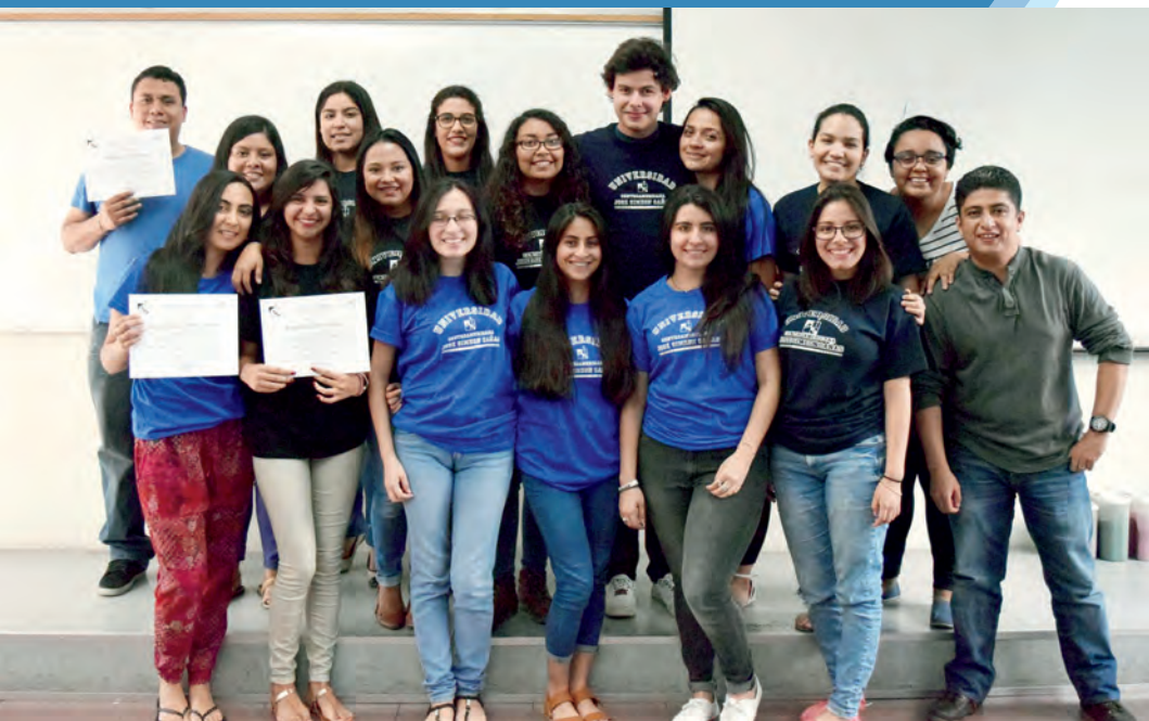
Estudiantes participantes del Programa de Liderazgo Ignacioano

Universitario Latinoamericano AUSJAL y el Programa de Formación en Acompañamiento. Otras áreas de acción del CAE son el apoyo y coordinación de actividades con las diferentes asociaciones estudiantiles que existen en las diferentes carreras y la realización de las elecciones para seleccionar mediante votación al Consejo Estudiantil.