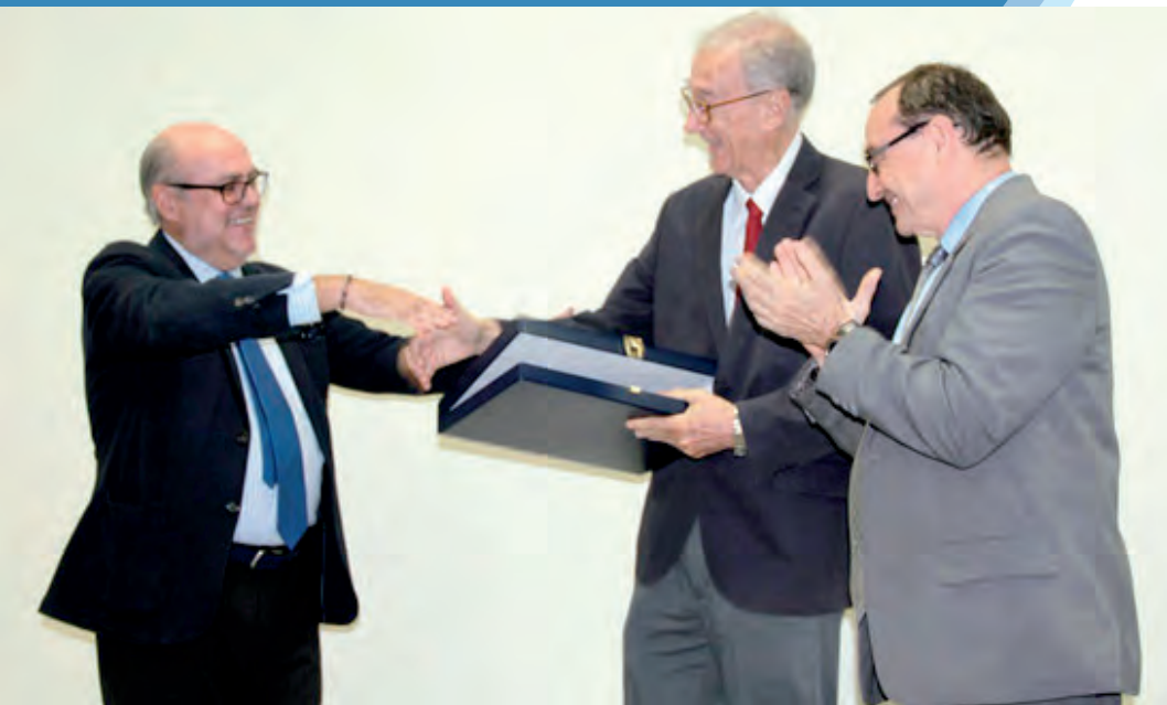
Entrega de reconocimiento de la Embajada de España al Idhuca por su labor.