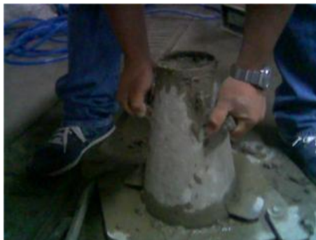
Figura 4. Retirando el molde del concreto