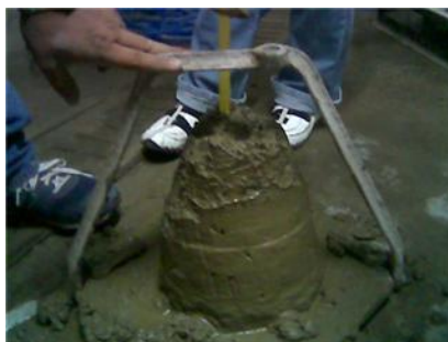
Figura 5. Lectura de revenimiento