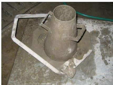
Figura 3. molde para revenimiento.