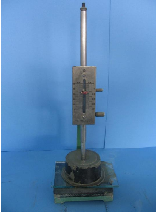
Fig. 2-7 medición de penetración de la aguja, foto por Tania Morales