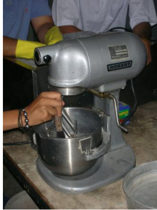
fig.2.2 Raspado de residuos adheridos en mezcladora