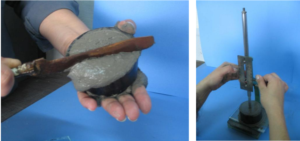
Fig 2-4 paso 5