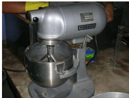
Fig.2.1 mezcladora mecánica