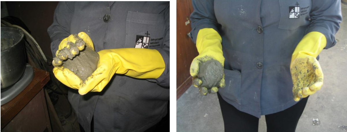
(Fig. 2-3 Paso 3, elaboración de bola de cemento)

Forme una bola con la pasta, la cual tendrá que arrojar de una mano a otra seis veces (procurando que la separación entre las manos sea de una seis pulgadas) o hasta producir una masa de forma cercana a la esférica, que pueda ser fácilmente colocada dentro del anillo Vicat (Ver la letra G en fig. 2-6) con una mínima presión adicional.