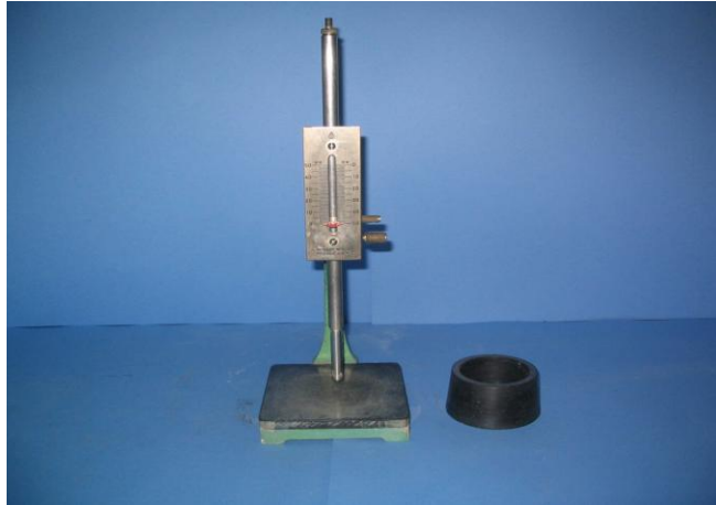
Fig 2-5 Aparato de Vicat, (foto por Tania Morales)