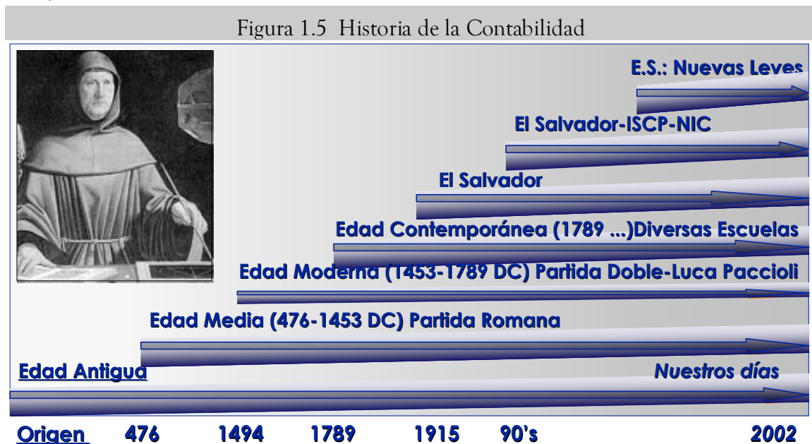
Fuente: Figura 1.5 corresponde al libro Contabilidad 1, 3Ed©2003, Manuel de J. Fornos

La contabilidad nació hace aproximadamente 5,000 años, desde que el hombre tuvo necesidad de conocer el valor de sus posesiones, deudas e ingresos. Existen vestigios de los registros de cuentas que llevaban los griegos, chinos, egipcios y babilonios. En el Antiguo Testamento encontramos referencias que nos permiten inferir que existía alguna forma de contabilizar. Entre ellas podemos citar las siguientes.