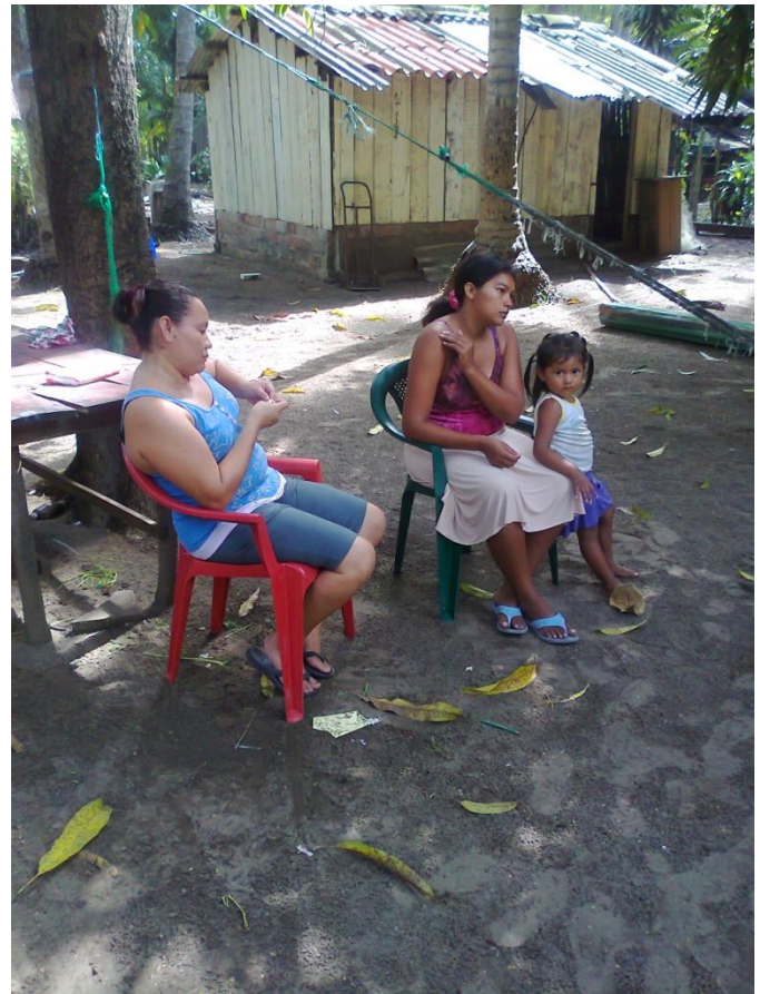
Entrevistas realizadas a mujeres de la Cooperativa "Las Barreñitas".