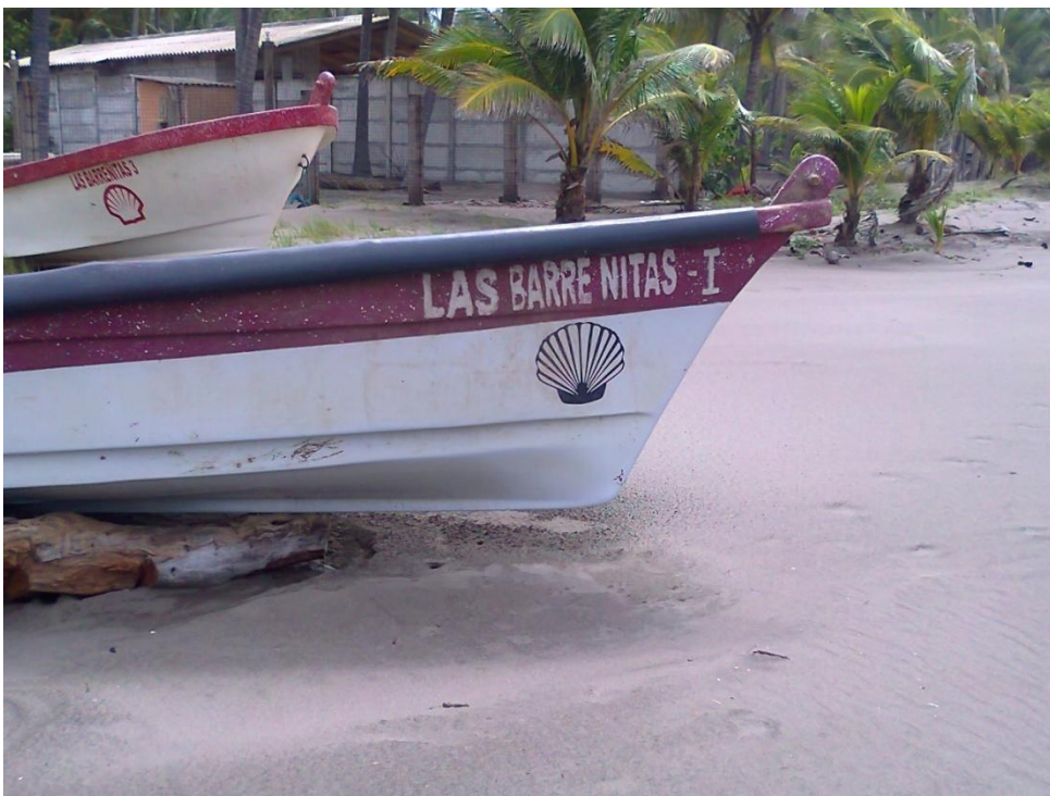
Lanchas pesqueras, pertenecientes a la cooperativa.