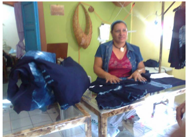
Textiles elaborados por las Mujeres Artesanas “Pájaro-Flor”