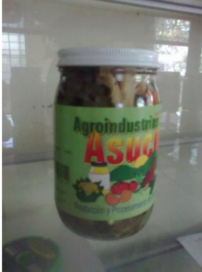
Encurtido elaborado por las mujeres de la Asociación de Asuchío.