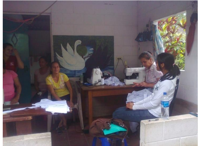
Caso 3: Mujeres Artesanas “Pájaro-Flor”, Municipio Suchitoto.