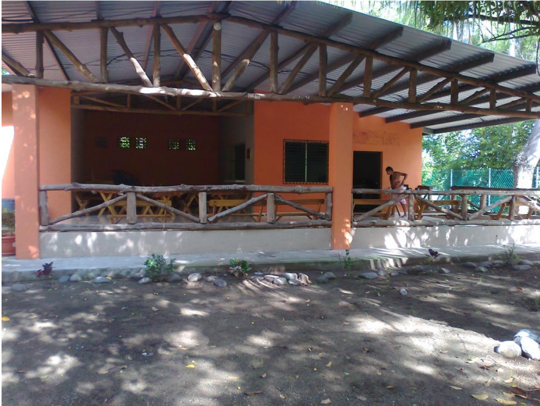
Comedor “Las Barreñitas”.