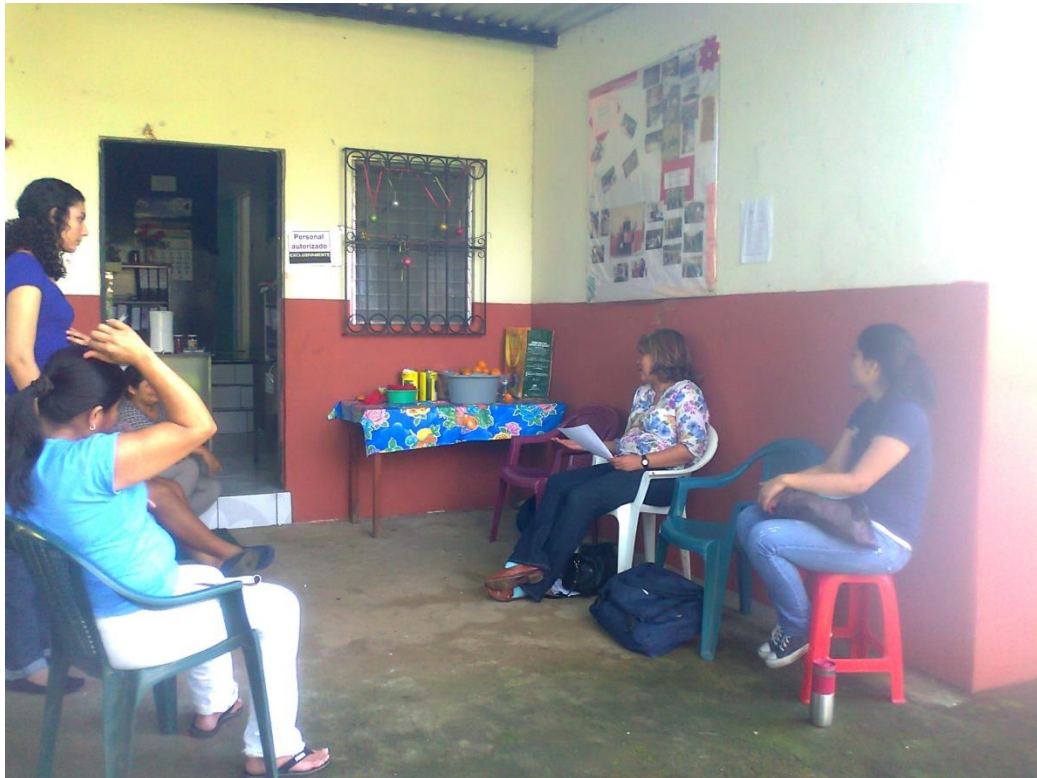
Entrevista realizada a mujeres de la Asociación de Desarrollo Comunal San Sebastián, Asuchío