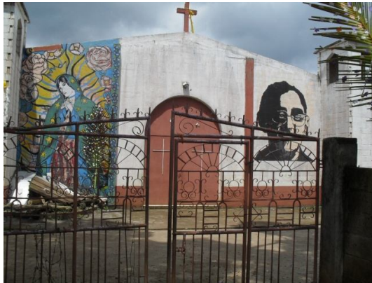
Viviendas en Santa Marta