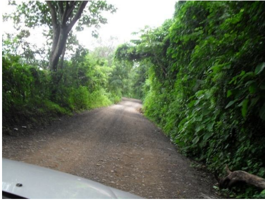
El Canton Santa Marta desde la