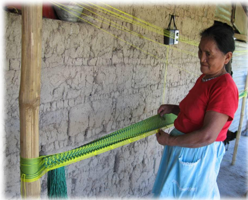
Congregación de madres de San Pedro, Cacaopera. Elaboración de Hamacas

Estos procesos comprueban que las mujeres urbanas y rurales – en el sector formal o informal de la economía – tienen un papel fundamental, no sólo como entes de reproducción social de la vida doméstica, sino también con sus capacidades creativas. Ellas desarrollan iniciativas productivas económicas y sociales que se utilizan como medio de empoderamiento y autorrealización, beneficiando así, no sólo a un pequeño grupo, sino también a toda la sociedad salvadoreña.