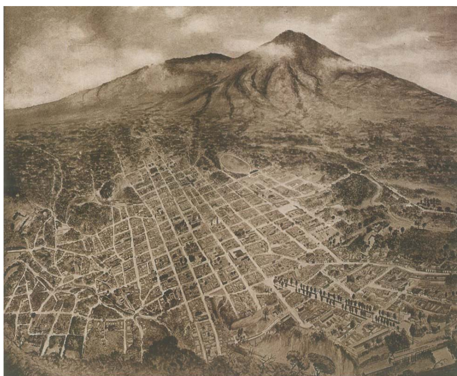
Tomada de El Libro Azul de El Salvador (1916), esta gráfica presenta a la ciudad de San Salvador en una vista de vuelo de pájaro, efectuada desde el cerro de San Jacinto.

Catálogo en Línea: www.uca.edu.sv Correo Electrónico: kmiller@bib.uca.edu.sv